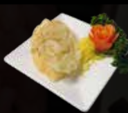
6. Pansit Goreng