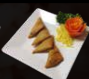
5. Kerrie Kok