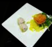
20. Siu Mai vleespastij