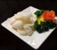
10. Kroepoek Naturel