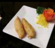
8. Gepaneerde Garnalen