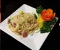
14. Bami Goreng