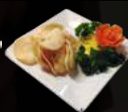
11. Kroepoek Casava