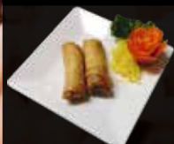
4. Mini Loempia's