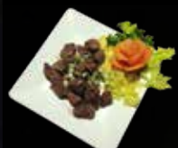
19. Beef Teriyaki