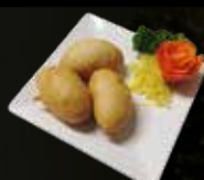
7. Pisang Goreng