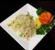
15. Nasi Goreng