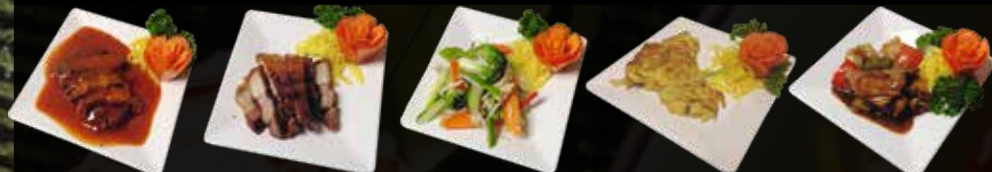
21. Babi Pangang