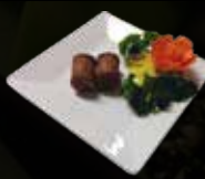
13. Mini Frikandel